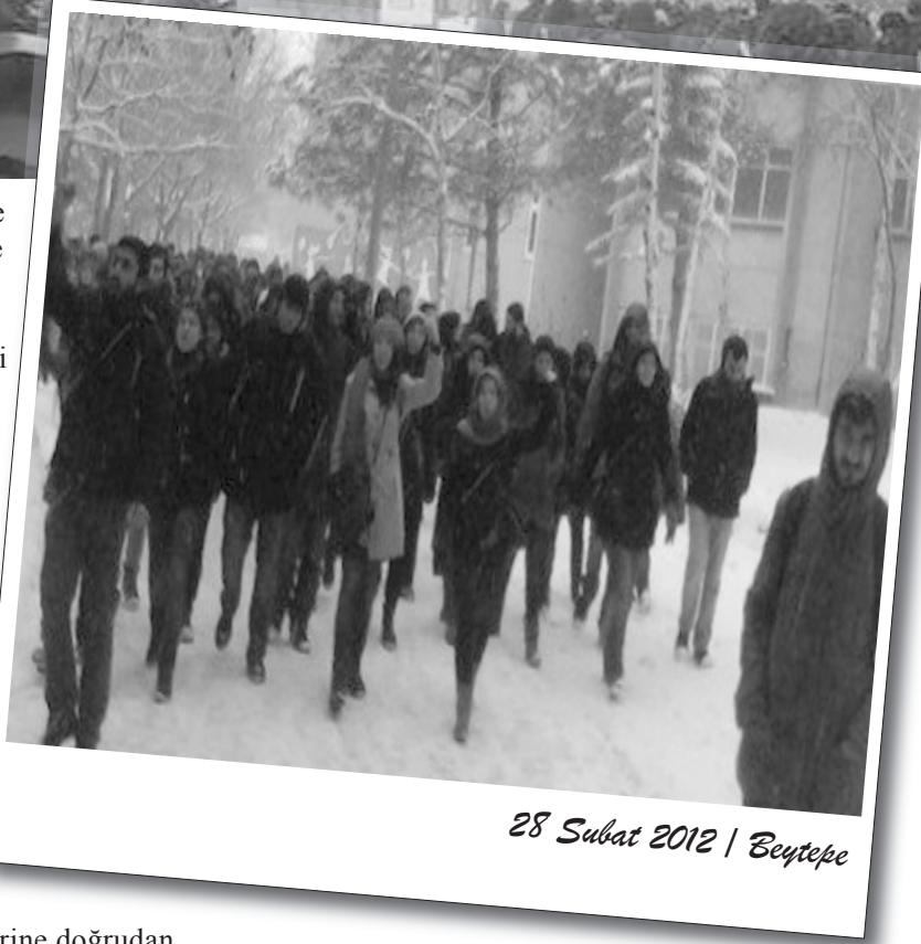
28 Şubat 2012 | Beytepe

Yaklaşık 150-200 kişilik bir faşist grup kampüse gelerek devrimci öğrencilere saldırdı. Hocalı etkinliği