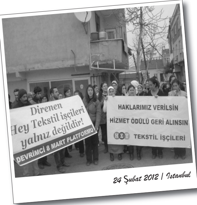
24 Şubat 2012 | İstanbul

Geçtiğimiz haftalarda Valiliğe, Kaymakamlığa, AKP önüne, Hürriyet gazetesine, Star Gazetesi'ne ve daha birçok yere giderek eylem gerçekleştiren Hey Tekstil işçileri hem eylemlerine devam ediyorlar hem de birçok sendika ve siyasetin ziyaretlerini kabul ediyorlar.