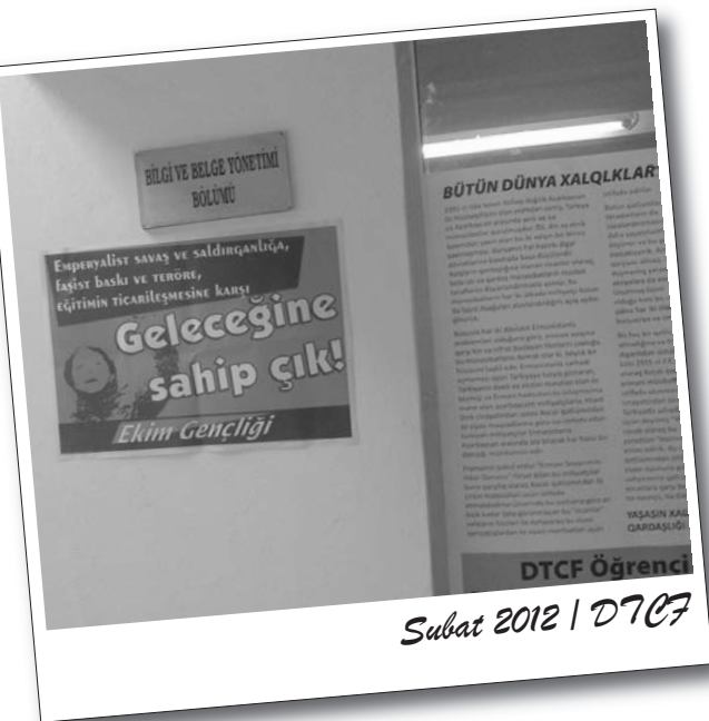
Subat 2012 | DTCF

Ekim Gençliği / Eskişehir - Ankara - İstanbul