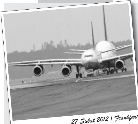
27 Şubat 2012 | Frankfurt

Ekonomik zorluk yaşadığı gerekçesi ile binlerce işçiyi işten atmaya hazırlanan şirket bir yandan da tesis ve makine üretiminde uluslararası alanda yatırım yapmayı planlıyor.