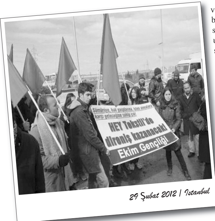
29 Şubat 2012 | İstanbul